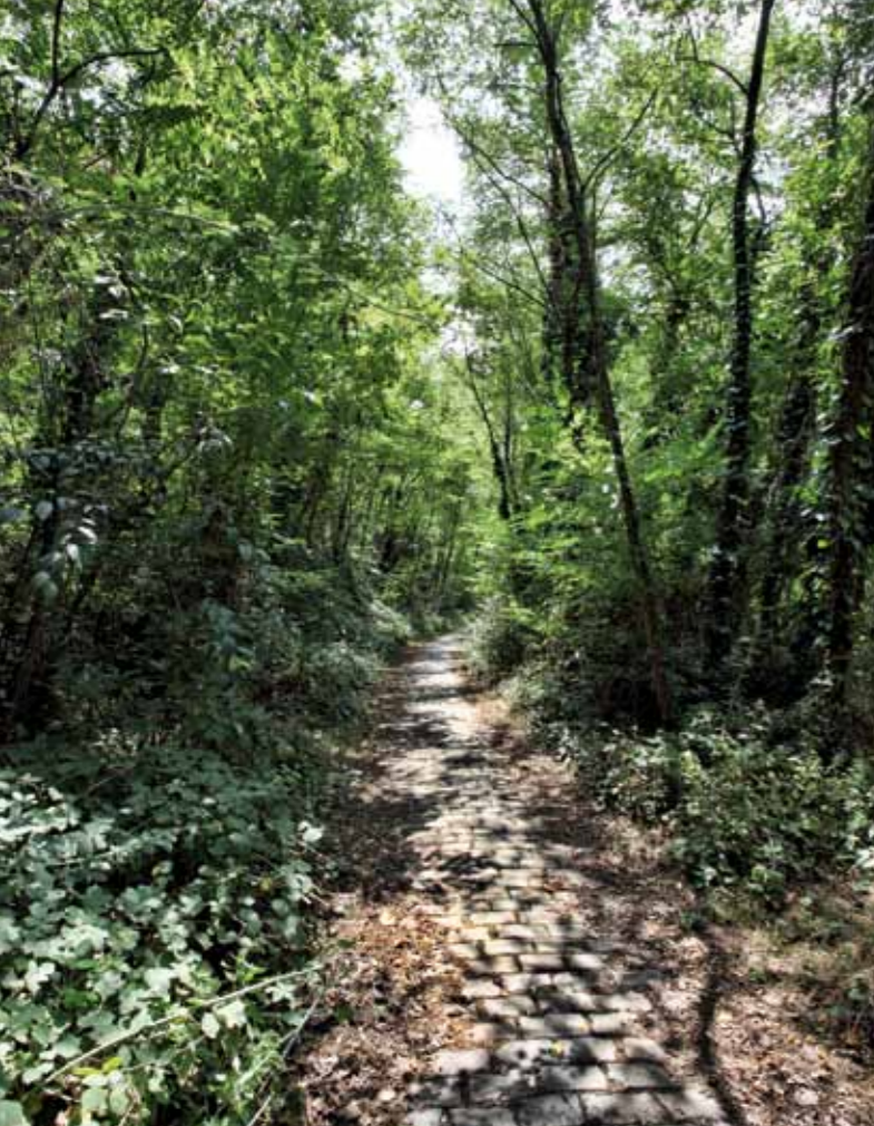
Camí del Foment